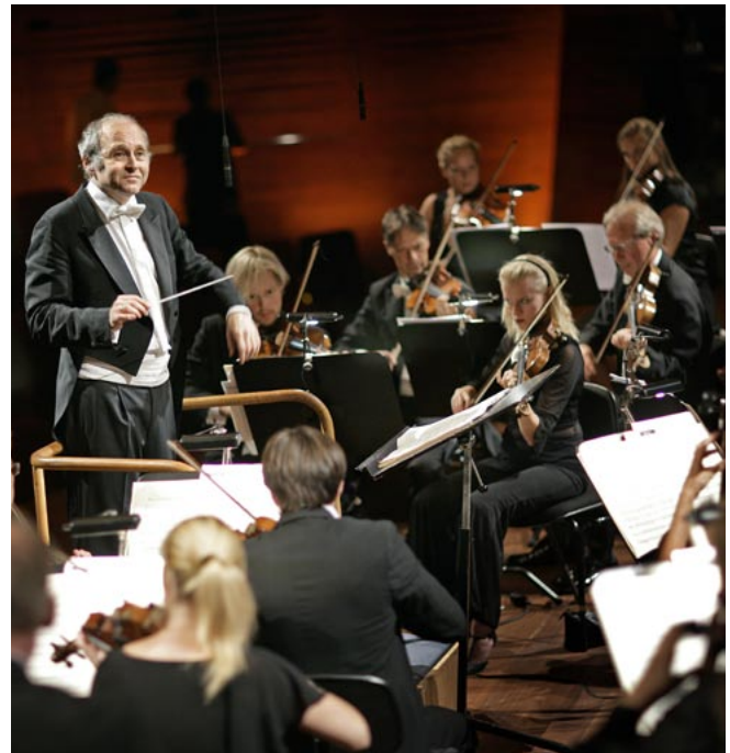
Adam Fischer med DR RadiounderholdningsOrkestret