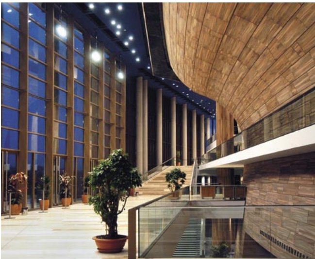
Parti fra Palace of Art i Budapest, hvor koncerterne finder sted

Efter morgenmad transfer til Lufthavnen.